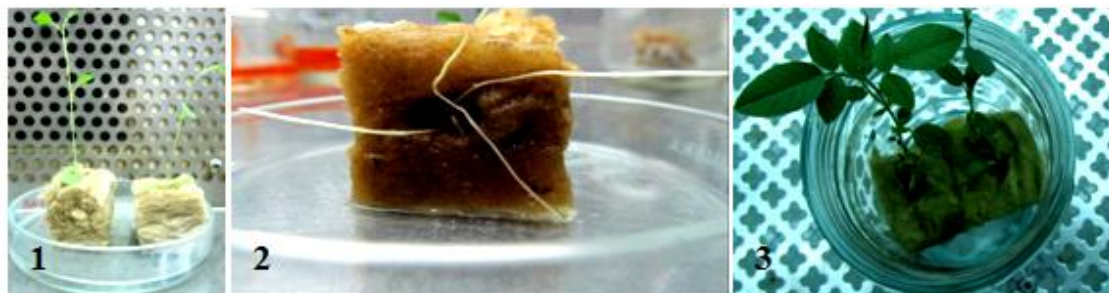
شکل ۲: تولید گیاهان کامپوزیت با استفاده از آگروباکتریوم ریزوژنز . نمونه‌های تلقیح شده با باکتری در داخل پشم سنگ فرو برده و سپس در پلیت قرار گرفتند (۱)، رشد ریشه‌های موپین ۳-۴ هفته پس از تلقیح (۲)، رشد قسمت هوایی گیاه کامپوزیت ۳-۴ هفته پس از تلقیح با باکتری (۳)

تأیید تراریختی ریشه‌ها با استفاده از آزمون هیستوشیمیایی GUS به روش جفرسون و همکاران (Jefferson et al. , 1987) انجام شد. جهت رنگ‌آمیزی نمونه‌ها ۱۰۰ میکرولیتر از استوک رنگ‌آمیزی 10X (۱۰۰ میلی‌لیتر استوک رنگ‌آمیزی 10X، ۵۰ میلی‌لیتر از بافر فسفات ۵۰۰ میلی‌مولار و ۲ میلی‌لیتر از EDTA ۱۰ میلی‌مولار به همراه ۱۰ میکرولیتر از Triton100X در ۴۸ میلی‌لیتر آب مقطر اتوکلاو شده)، ۰/۱ میکرولیتر مرکاپتواتانول، ۲۰ میکرولیتر از محلول (5-bromo- X-Gluc 4chloro-3-indolyl-β-glucuronic acid) در ۸۸۰ میکرولیتر آب مقطر استریل حل شد سپس قطعاتی از لاین‌های ریشه تراریخت و یک ریشه غیرتراریخت به‌طور جداگانه در تیوب‌های ۰/۲ میلی‌لیتری حاوی ۲۰۰ میکرولیتر محلول رنگ‌آمیزی منتقل شدند و به مدت ۲۴ ساعت در دمای ۳۷ درجه در انکوباتور آنکوبه شدند سپس با الکل ۷۰ درصد و آب مقطر استریل شسته شدند.