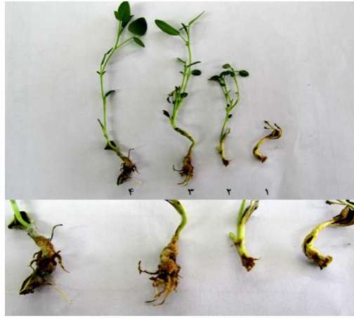
شکل ۳: مقایسه رشد ریشه‌های مویین گیاه کامپوزیت در محیط کانامایسین و فاقد کانامایسین دو هفته پس از تلقیح با باکتری: گیاه شاهد در محیط حاوی ۲۵ میلی‌گرم در لیتر کانامایسین (۱)، گیاه شاهد در محیط بدون کانامایسین (۲)، گیاه تراریخت در محیط بدون کانامایسین (۳)، گیاه تراریخت در محیط حاوی ۲۵ میلی‌گرم در لیتر کانامایسین (۴)